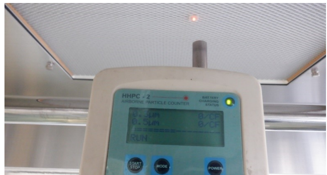
パーティクル 吹出し部で測定